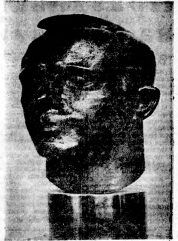
Ю. ЧЕРНОВ. Гагарин.