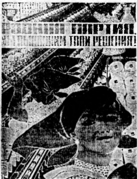
ПЛАКАТ Д. ХВОСТЕНКО. (г. Киев).

С 14 по 18 апреля на Дону проходит Всесоюзная неделя изобразительного искусства, посвященная 60-летию образования СССР и 65-летию Великого Октября.