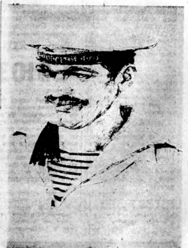
Б. ЕФИМОВ, секретарь правления Союза художников СССР, народный художник СССР, действительный член АХ СССР, лауреат Государственных и международных премий СССР.

В самой глубине души хранят обычно люди искреннюю любовь. И не по каждому поводу станут говорить о ней. Так и художник: боится и суетных признаний, и дубочных красок. Расчет у него иной — на чуткое сердце зрителя. На такое сердце, которое в неброском лике России — в ее оглохших причалах, пеньках — увидит нечто большее, чем пейзаж с природы.