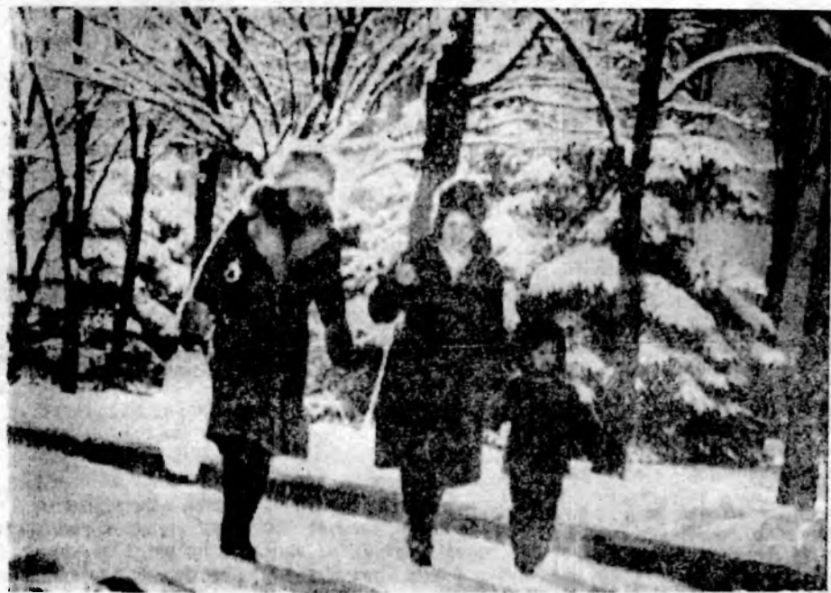
Улица Ленина в нашем городе красива и летом, и зимой. А главным украшением ее служат зеленые насаждения и особенно пышные ели.

Предприятиям, организациям, жилищно-коммунальным хозяйствам даны задания по своевременному приобретению посадочного материала, выделению транспорта, монтажу поливочного водопровода, по оформлению скверов и уголков отдыха, вертикальному озеленению.