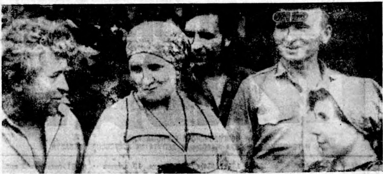
Успешно справляется с напряженными производственными заданиями работники литейного цеха опытно-экспериментального завода.

Центральный Комитет КПСС обязал партийные комитеты усилить внимание средств массовой информации и пропаганды вопросам контроля и проверки исполнения. Рассматривать широкую гласность этой работы как необходимое условие повышения эффективности контроля, активного привлечения трудящихся к управлению производством, всеми делами общества. Редакции центральных, республиканских и местных газет и журналов, телевидения и радиовещания призваны всесторонне освещать ход выполнения трудовых коллективами директив партии и правительства, социалистических обязательств, доходчиво раскрывать наиболее эффективные формы и методы контроля рожденные практикой партийных организаций в ходе осуществления решений XXVI съезда КПСС.