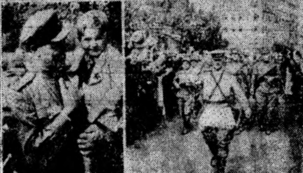
Разгромна вражеские позиции и подбиты орудия от них Родина, Советский народ начал освободительный поход по странам Европы, явившись на помощь и борьбе с фашистской Германией.