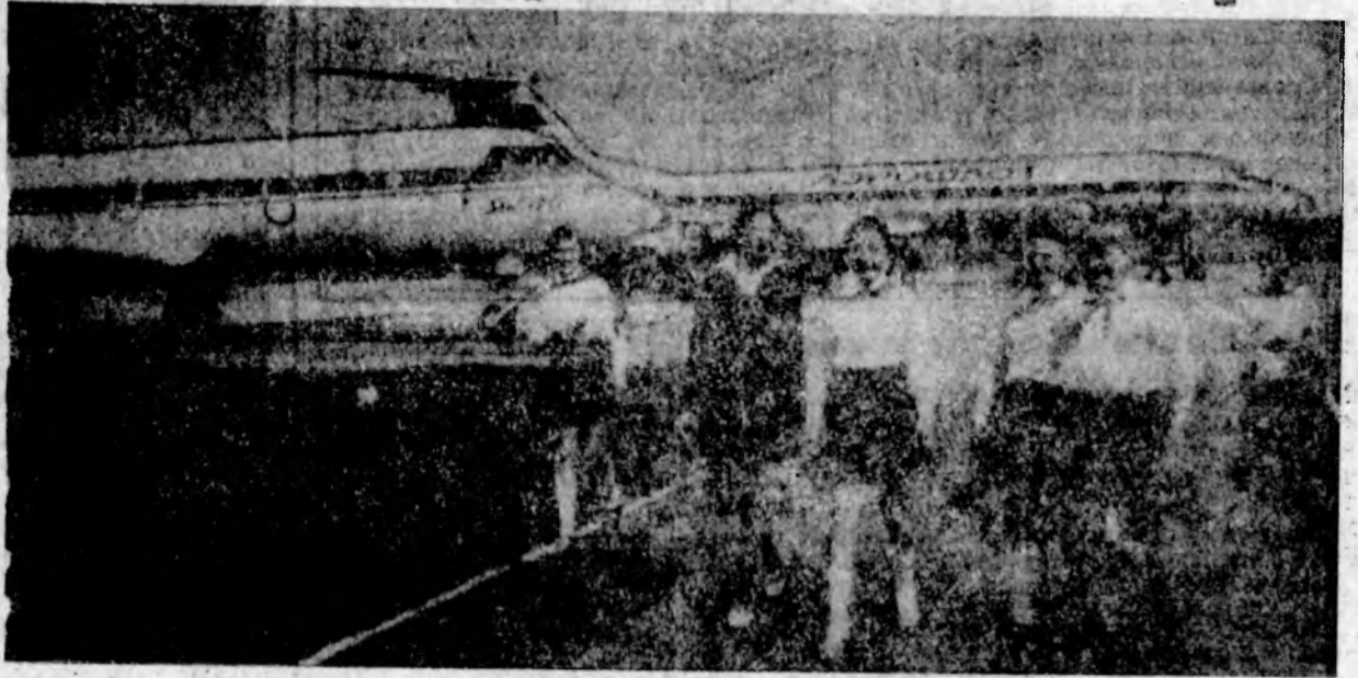
В Волгодонском аэропорту.