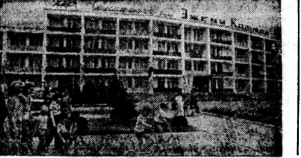
В Анапе — Всесоюзной детской здравнице — действуют 170 круглогодичных и сезонных санаторно-курортных учреждений. На снимке внизу: санаторий имени Эжени Котков. В нем ежемесячно отдыхают 600 человек.