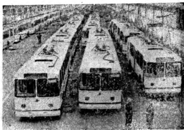
По месту жительства