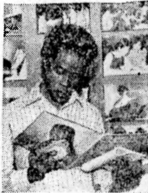
ДЕЛИ. В индийской столице действует по-

стоянный выставочный павильон торгового представительства СССР (на снимке сверху). В нем представлены образцы промышленной продукции, поставляемой советскими экспортными организациями в Индию.