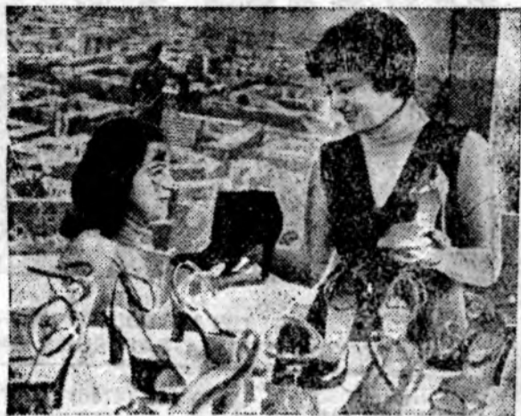
Армянская ССР. Коллектив ордена Трудового Красного Знамени Ереванского производственного объединения «Масис» рапортовал о досрочном выполнении плана пятилетки. Удельный вес обуви, выпускаемой с государственным Знаком качества, составляет 30 процентов, а с индексом «Н» (новинка) — 62 процента.

В Армении действуют 14 театров, 39 музеев, 1204 клубных учреждений, 826 киноустановок, 1328 масовых библиотек с книжным фондом свыше 19 млн. экз., 123 детские музыкальные, художественные и хореографические школы, которые насчитывают около 30 тыс. учащихся.