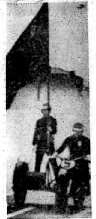
На снимках: волгодонцы на праздничной демонстрации.