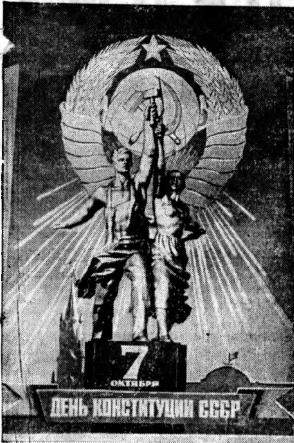
Плакат художника В. Викторова. Издательство «Плакат».