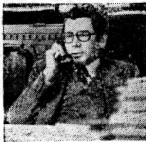
На снимке: в рабочем кабинете.

Известный украинский писатель Павел Архипович Загребельный — автор книг «Европа-45», «Добрый дьявол», «Первост», «Переходим к любви», «Евпраксия». За роман «Разгон» он выдвинут на соискание Государственной премии СССР 1980 года. Писатель ведет большую общественную работу, он — депутат Верховного Совета СССР, первый секретарь правления Союза писателей Украинской ССР.