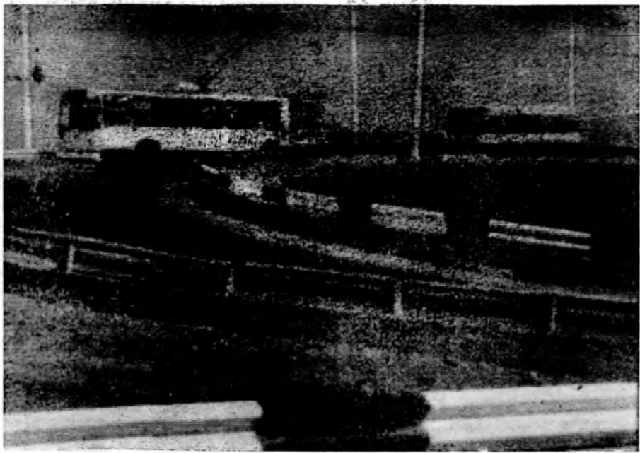
Выполнены большие работы по благоустройству путепровода и моста в юго-западном районе города. Особенно отличились здесь бригады «Промстрой-2».