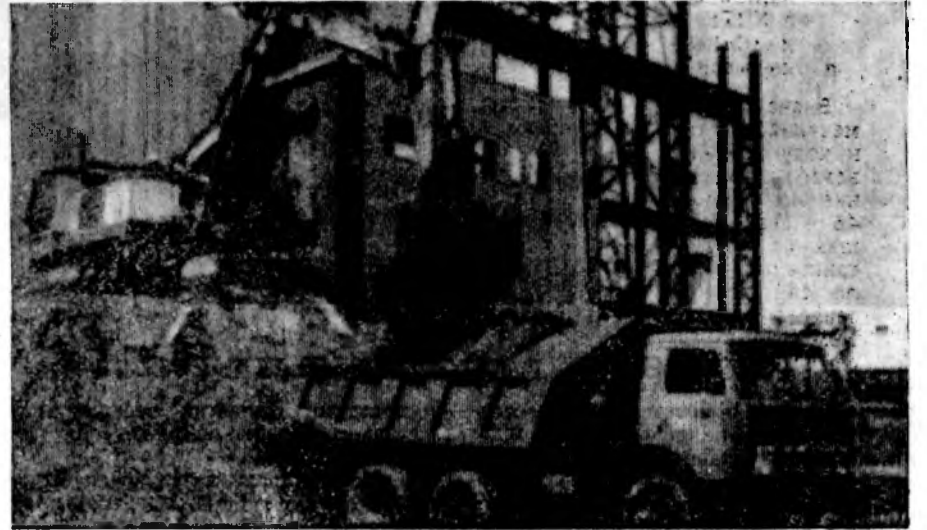
Полным ходом идет благоустройство территории, прилегающей ко второму корпусу завода «Атоммаш» (на снимке).