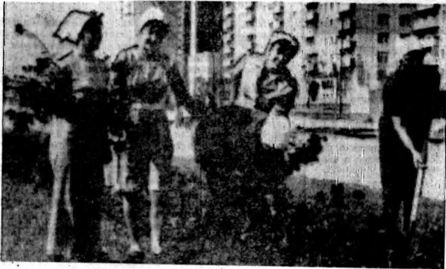
С каждым днем все краше и благоустроеннее становятся улицы нашего города. На снимке: благоустройство проспекта Строителей в новом городе ведут работники спецРСУ и УЖКХ «Атоммаша».

За время декадника заасфальтируем дорогу за рынком, улицы 50 лет СССР в Ленинском районе, установим турникет около дома быта и приведем в порядок шапку № 14 и 15.