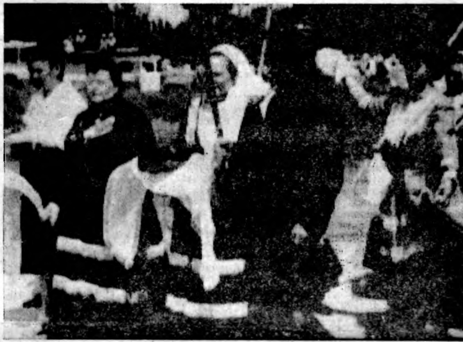
На снимке внизу — жители Волгодонска приветствуют хлебом-солью казаки станицы Романовской.

«Будут созданы сооружения еще более величественные, чем Волго-Дон. Но в памяти людей Волго-Дон останется первенцем великих строек», — так сказал на торжественном митинге, посвященном открытию Волго-Донского судоходного канала имени В. И. Ленина наш земляк, известный всему миру донский писатель Михаил Шолохов. Его слова были пророческими. Образно говоря, первостроители 30 лет назад посадили семечко, из которого у Цимлянского моря, под мирным небом выросло огромное прекрасное дерево, и год от года у него появляются новые могучие ветви.