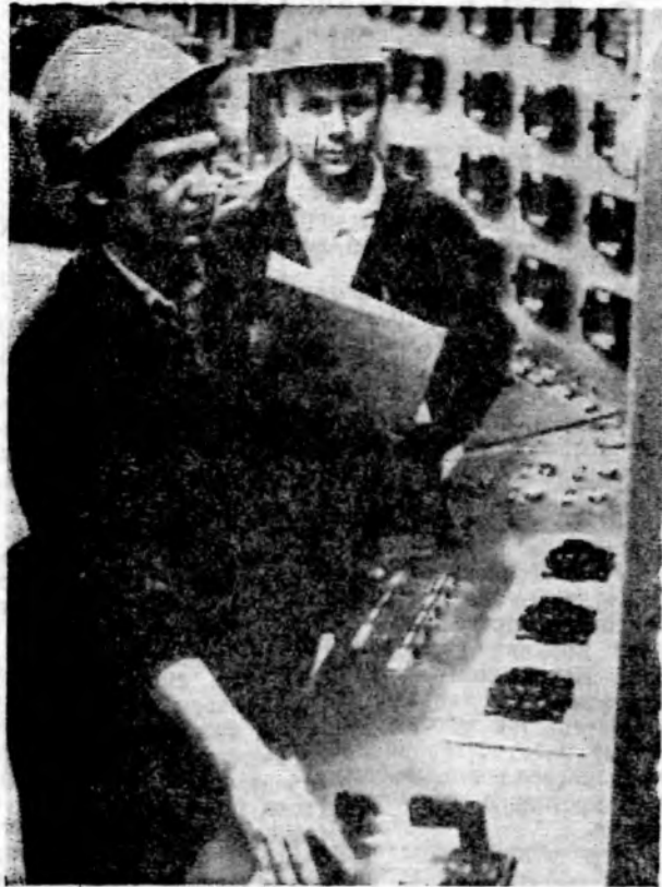
С пульта управления процессом сушки моющих средств в цехе № 4 химзавода подаются команды на различные механизмы технологической линии. И очень важно, чтобы были они четкими, своевременными.