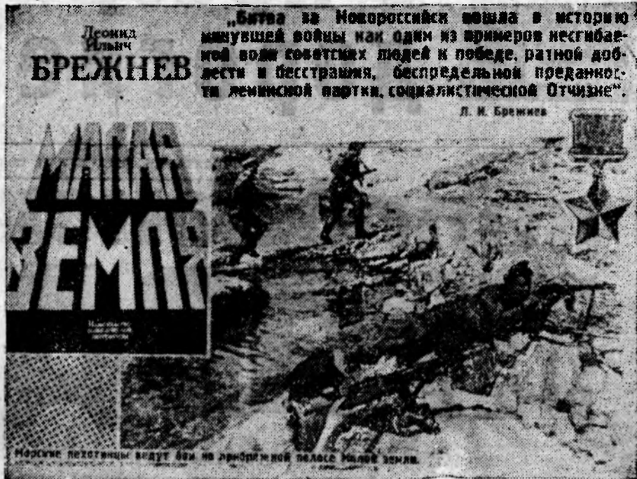
Морские пехотинцы ведут бой на прибрежной полосе Малой земли.