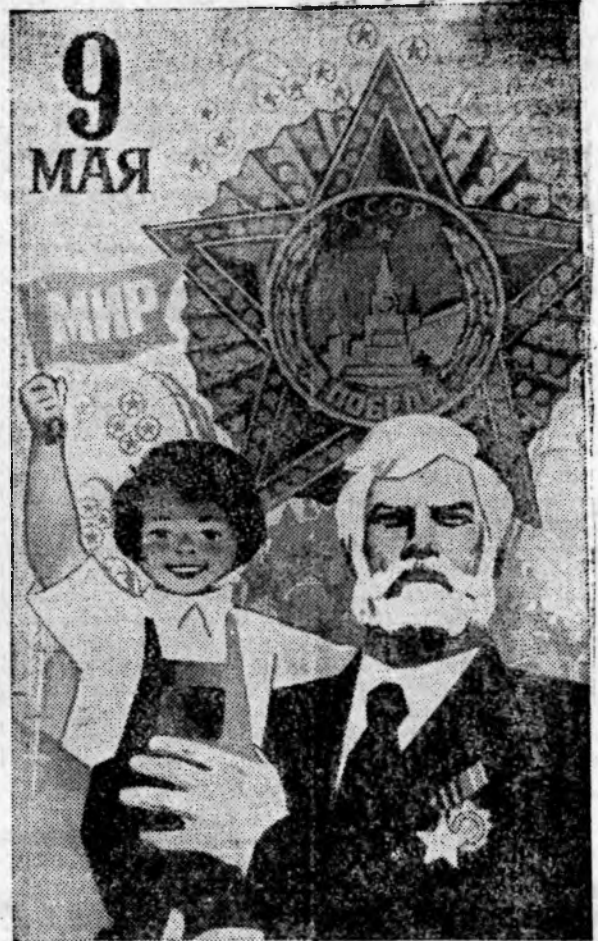
Плакат художника И. Коминярца. Издательство «Плакат».