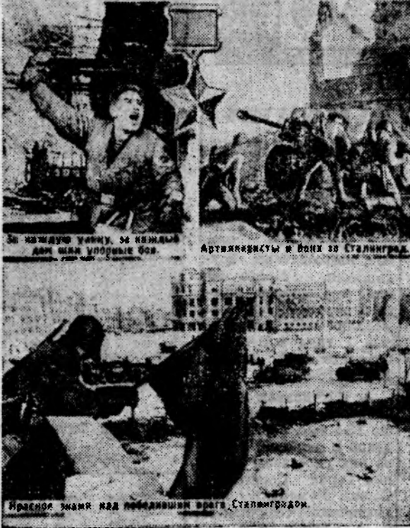
◆ За каждую улицу, за каждый дом шли упорные бои. ◆ Артиллеристы в боях за Сталинград. ◆ Красное знамя над победившим врага Сталинградом.

Сталинградская битва, которая по своему значению и размаху превзошла все битвы и сражения прошлого, положила начало коренному перелому в ходе Великой Отечественной войны.