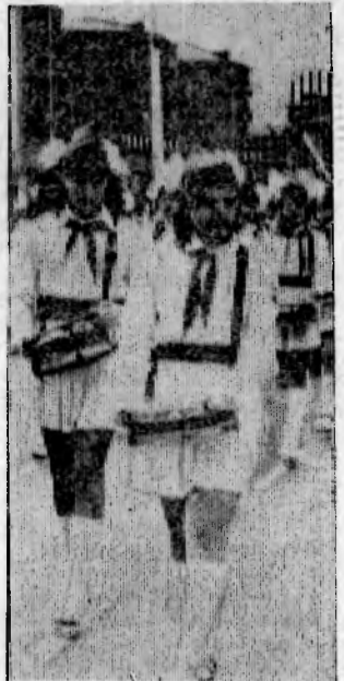
На снимках: ПЕРВОМАЙ В ВОЛГОДОНСКЕ.

П О ТРАДИЦИИ первыми на центральную площадь города, площадь Победы, вступили передовики производства, ветераны партии и труда, наставники. В руках лучших представителей рабочей гвардии города — наши знамена: знамя города Волгодонска, знамя Советского Министров РСФСР и ВЦСПС и знамя обкома КПСС облисполкома, облисполкома и обкома ВЛКСМ, которыми город награжден за победу во Всероссийском и областном социалистическом соревновании.