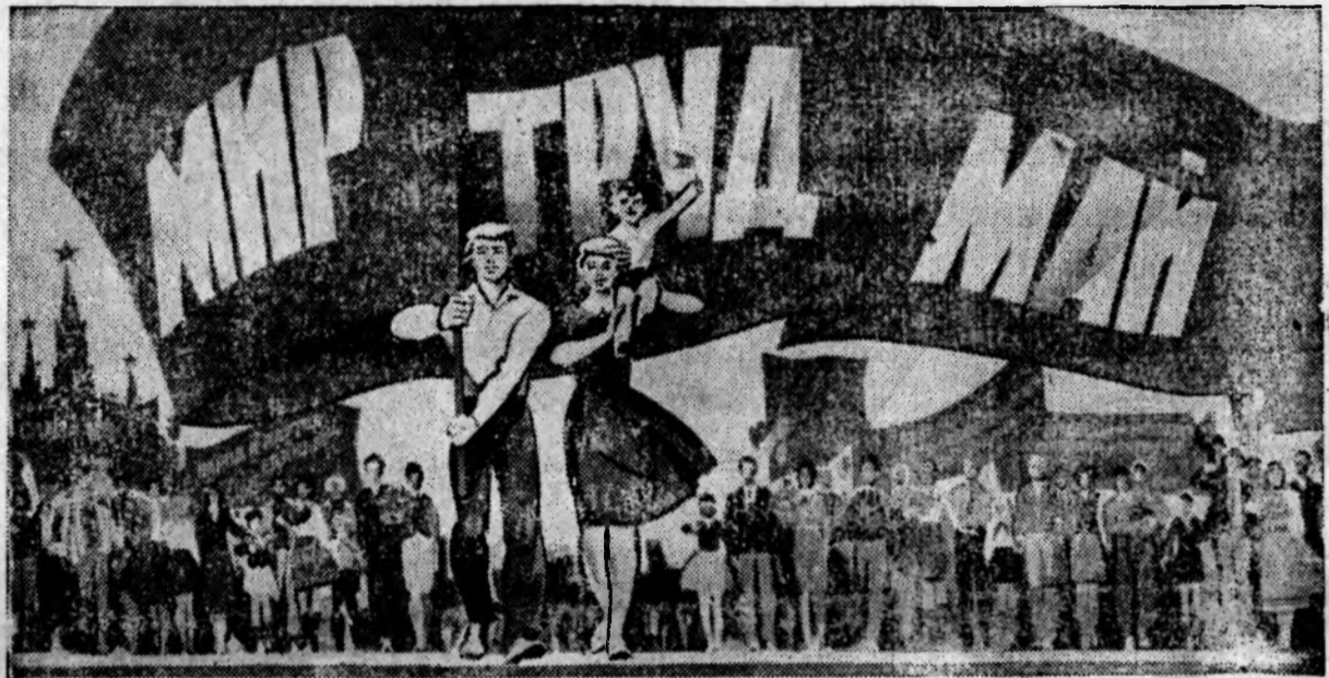
Плакат художника В. Сачкова. Издательство «Плакат».