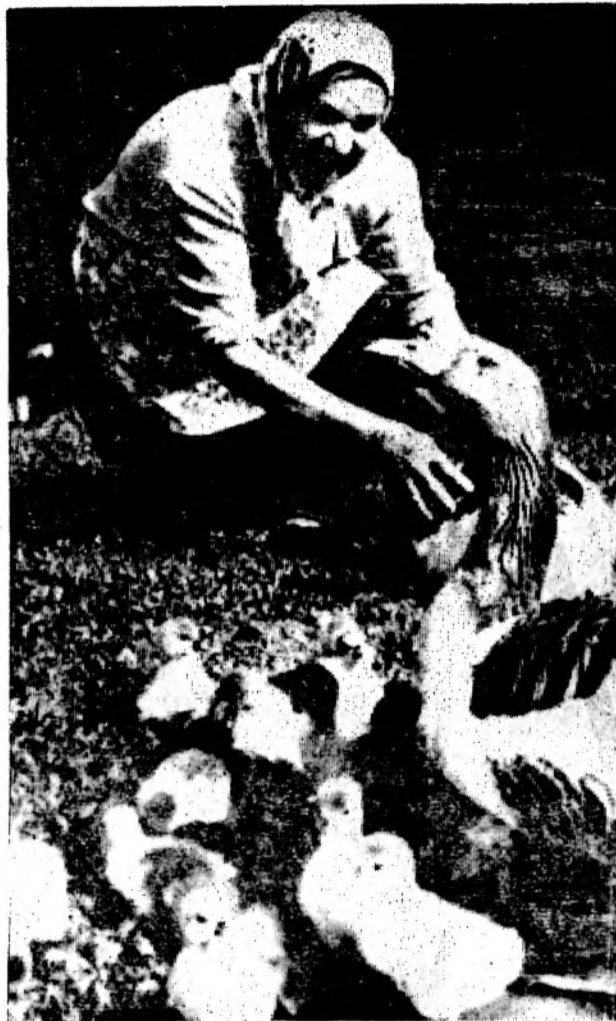
Жили у бабули маленькие гуси...

В. БЕЛЯКОВА, лейтенант милиции, инспектор детской комнаты.