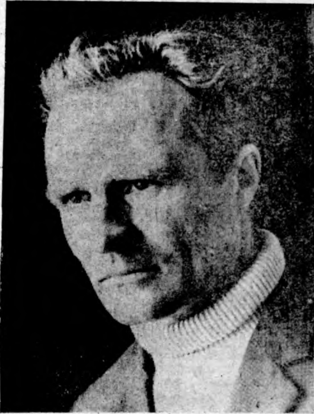
В этом году партийный комитет и правление колхоза имени Карла Маркса, делом отвечая на призыв боковцев, решили подготовить 54 механизатора. 20 из них будут обучены профессии штурвального. Многие ветераны полеводства — передовые трактористы и комбайнеры — окажут помощь в выполнении этого мероприятия.

● ПРОМЫШЛЕННЫЕ предприятия и организации города Цимлянска обучат специальности механизатора 46 человек.