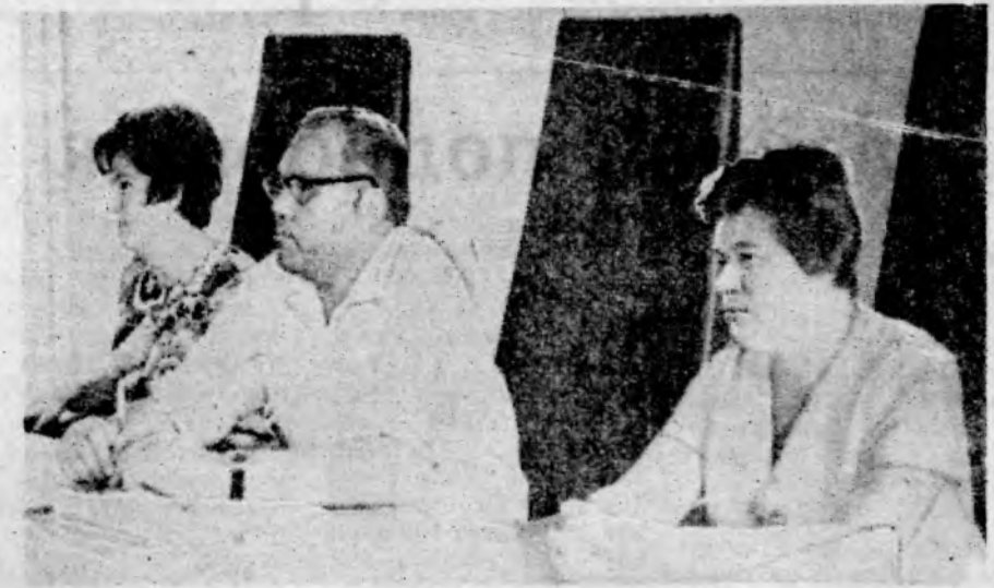
Репортаж из-за суда