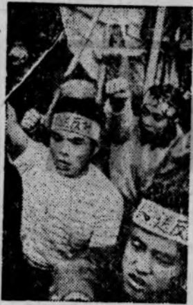
ЯПОНИЯ. Продолжается борьба миролюбивых сил Японии против отправки в Индокитай американской военной техники, отремонтированной на базе Сагами. НА СНИМКЕ: молодежь, принявшая активное участие в демонстрации перед воротами американской базы.