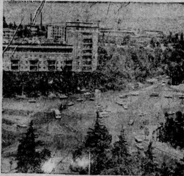
Столица Грузинской ССР — Тбилиси. Площадь Героев.

(Из постановления ЦК КПСС «О подготовке к 50-летию образования СССР»).