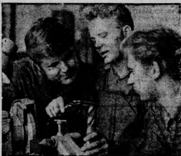
Знатные люди республики

Площадь культурных пастбищ в Эстонии достигла в этом году 150 тысяч гектаров.