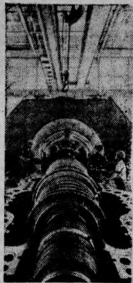
Узбекская ССР. В Голдской степи на берегу реки Сырдарья сооружается ГЭС мощностью 4,4 миллиона киловатт. Ввод в действие ее первых агрегатов намечен Директивами XXIV съезда КПСС. Могучие котлы станции будут работать на природном газе. До пуска первого турбогенератора Сырдарьинской ГЭС (его мощность — 300 тысяч киловатт) останутся считанные месяцы, ввод в действие намечается в декабре текущего года. В сооружении ГЭС участвуют предприятия Ленинграда, Запорожья, Новосибирска и других городов страны. Сюда, на Всесоюзную ударную комсомольскую стройку, съехались тысячи молодых строителей.

Отмеченные недостатки — следствие того, что отдельные партийные, профсоюзные, комсомольские организации и руководители транспортных организаций, предприятий промышленности, строительства и учреждений города подходят к вопросам повышения эффективности использования транспорта без всесторонней обоснованности, серьезного повышения требовательности, персональной ответственности работников всех рангов за порученное дело. У нас имеются предприятия и организации, где не на должной высоте уровень партийного руководства экономикой, имеются серьезные упущения в организаторской и политической работе.