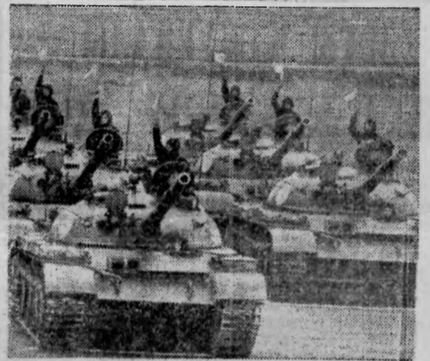
На снимке: танкисты на смотре войск после учений.