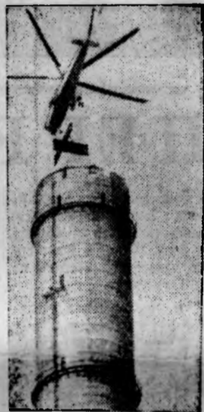
Волгореченки (Костромская область). Быстрыми темпами ведется сооружение крупнейшей в мире Костромской ГРЭС. Для ускорения ввода новых мощностей здесь предстояло выполнить очень сложную работу — смонтировать 120 тонн металлоконструкций на вершине дымовой трубы. На снимке: вертолет МИ-10К с конструкторской над 250-метровой трубой.

Имеет все возможности выполнить задание по яйцу и главный поставщик этого вида продукции птицевосхоз имени Черникова. Без учета сверхплановых закупок птицеводы хозяйства годовой план сдачи яиц уже выполнили на 94 процента.