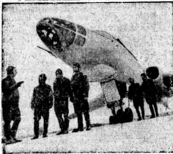
НА СНИМКЕ: экипаж ракетоплана перед вылетом на задание.