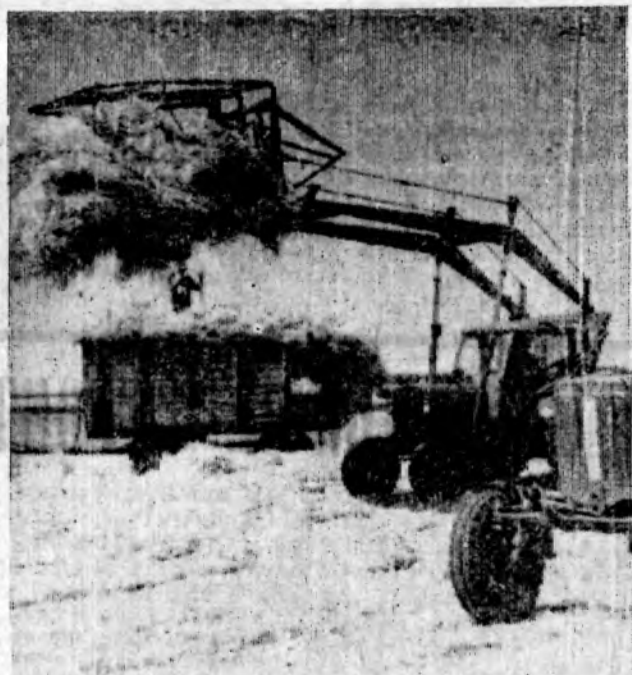
В колхозе «Клич Ильича» продолжается заготовка соломы на корм скоту. Она подвозится с плей и мест зимовки скота.