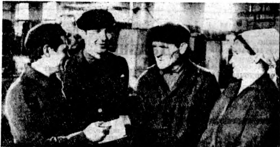
Народные контролеры механического цеха № 4 опытно-экспериментального завода часто проводят рейды, проверяют качество выпущенной продукции. На счету у контролеров десятки тысяч сэкономленных рублей.