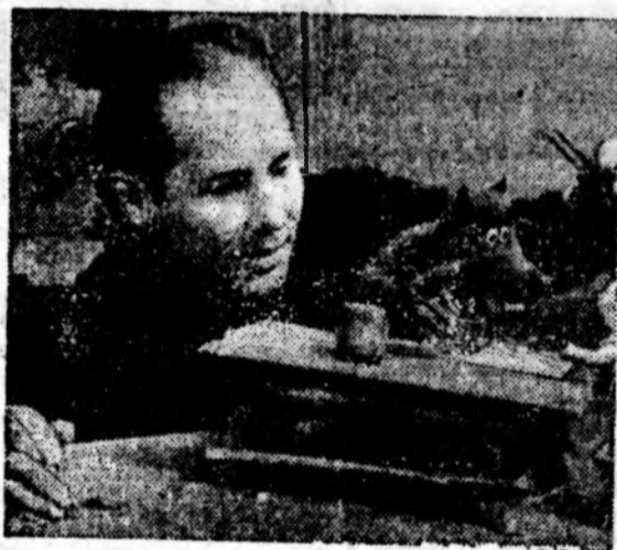
Творческое Объединение художественной мультипликации. Киевской студии научно-популярных фильмов готовит к выпуску ряд новых кинолент: «Сказание про Игоря похода», «Поросенок, который любил играть в шашки», «Тигренок в чайнике» и другие.