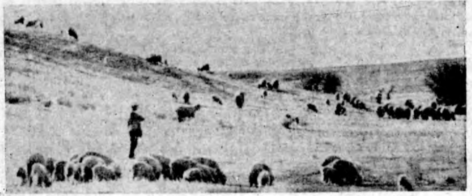
Почти круглые сутки находятся на выпасах овцы колхоза «Искра». Сочные травы, свежий воздух способствуют хорошему нагулу животных. НА СНИМКЕ: овцы колхоза «Искра» на выпасах.