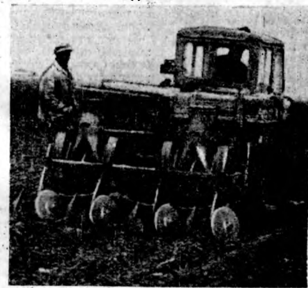
Механизированное звено овощесовхоза «Волгодонской» дало слово получить с каждого гектара по 180 центнеров клубней картофеля. НА СНИМКЕ: посадка картофеля.