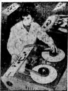
На Ленинградском электромеханическом заводе налажено серийное производство числовых программных устройств для металлообрабатывающих станков, каждое из них заменяет от 7 до 16 квалификационных станочников.

Прирост урожая зерна кукурузы прекращается в восковой спелости. В этой фазе и надо начинать уборку ее на зерно. Приходится, однако, учитывать, что в начале этой фазы зерно кукурузы имеет влажность около 20—25 процентов. Оно требует досухки, чтобы в нем осталось не более 14 процентов воды. При такой влажности кукуруза хорошо хранится, не теряет всхожести при зимних морозах, не будет согреваться и плесневеть. При перестое кукурузы в фазе полной спелости урожай зерна снижается, так как часть сухого вещества расходуется на дыхание.