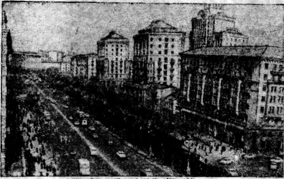
Киев — столица Украинской Советской Социалистической Республики. НА СНИМКЕ: центральная магистраль города — Крещатик.

(Из Постановления ЦК КПСС «О подготовке к 50-летию образования СССР»).