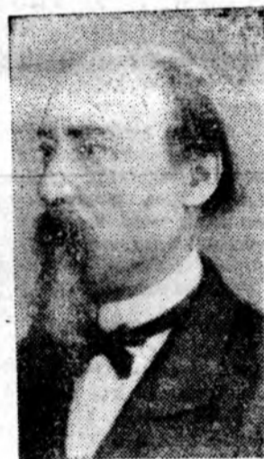
ные записки», работая рука об руку с Белинским, Чернышевским, Добролюбовым, Салтыковым-Щедриным.

В условиях жесточайшей царской цензуры, преследований и подчас трагичнейшим жандармским надзором самодержавия, Некрасов был не только певцом-лириком, но и передовым деятелем просвещения. Два десятилетия стоял у руля самых прогрессивных журналов своего времени «Современник» и «Отечествен-