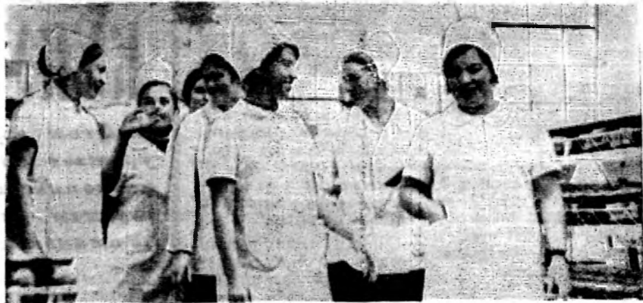
Большой популярностью пользуется у волгодонцев гастроном № 16. Здесь, на прилавках к вашим услугам широкий ассортимент продуктов. Дружный коллектив стремится как можно лучше обслужить своих покупателей, перевыполнить план товарооборота.

НА СНИМКЕ: продавцы перед открытием магазина.