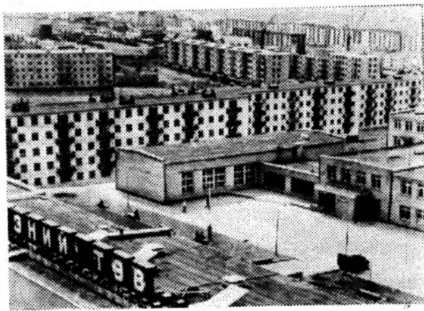
Советский Союз принимает участие в создании основных индустриальных центров республики. С его помощью строятся или расширяются свыше 250 промышленных и сельскохозяйственных предприятий. НА СНИМКЕ: 15-й микрорайон Улан-Батора, построенный с помощью Советского Союза.

Течет иссиня-зеленой лентой, петляя по засухливым степям юга, спокойная и немногочисленная река Сал. Десятки хуторов выросли на ее берегах. И многие из них, не претендуя на громкую славу, имеют свою боевую и трудовую биографию.