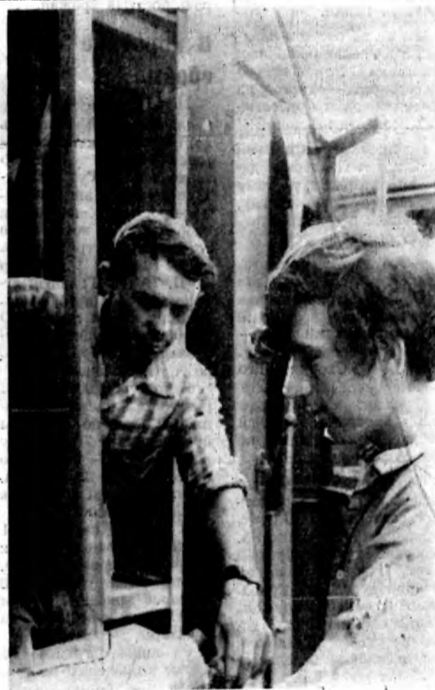
Волгодонской участок треста «Кавэлектромонтаж» выполняет различные монтажные работы на предприятиях Волгодонска, а также устанавливает линии освещения на площадях и улицах города.

Отмечена хорошая работа коллективов хлебозавода, ВУМСа, железнодорожной станции Волгодонск ая, трансгазотства, гортопбыта.