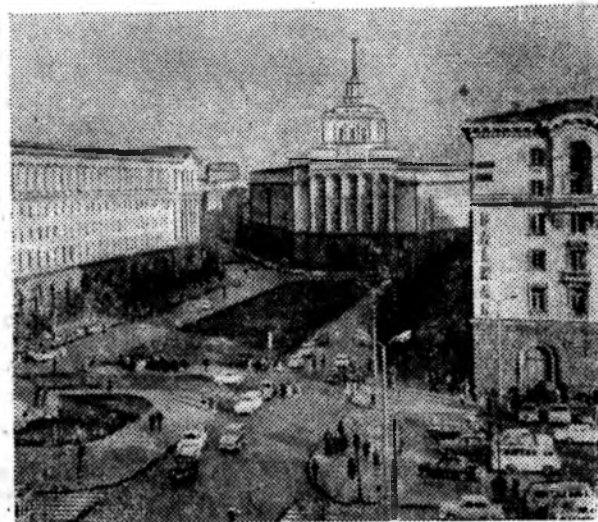
СОФИЯ. Площадь имени Ленина.

Молодое поколение Болгарии пользуется особым вниманием и заботой правительства. Школьники ведут занятия в светлых просторных классных комнатах, здесь хорошо оборудованные кабинеты, квалифицированные преподаватели.