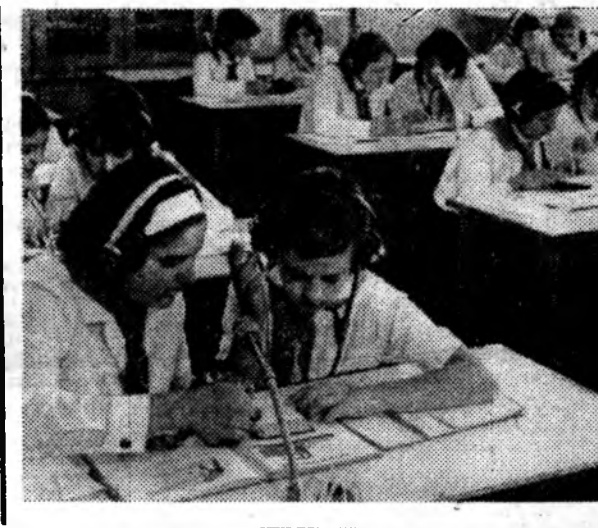
Что ты даешь пятилетке?