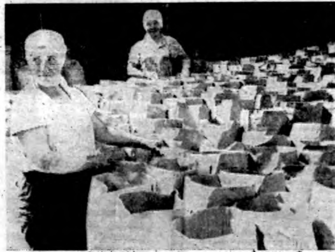
Большую задачу поставили перед собой птицеводы совхоза имени Черникова. Они решили в нынешнем году заготовить более 350 тонн витаминной травяной муки.