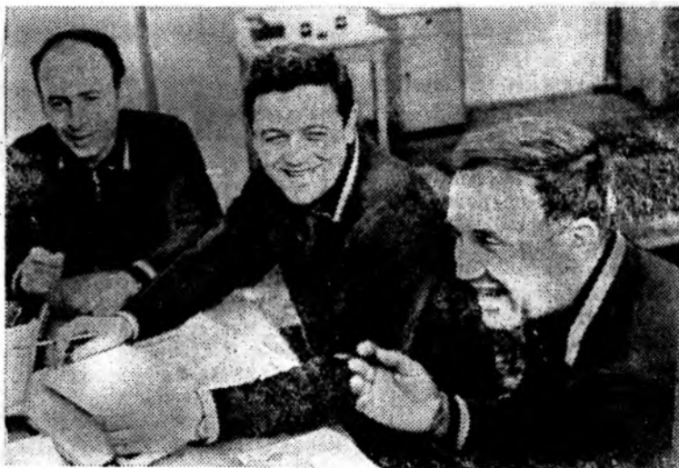
Экипаж космического корабля «Союз-11» (слева направо): инженер-испытатель В. И. Пацаев, бортинженер В. Н. Волков и командир Г. Т. Добровольский.