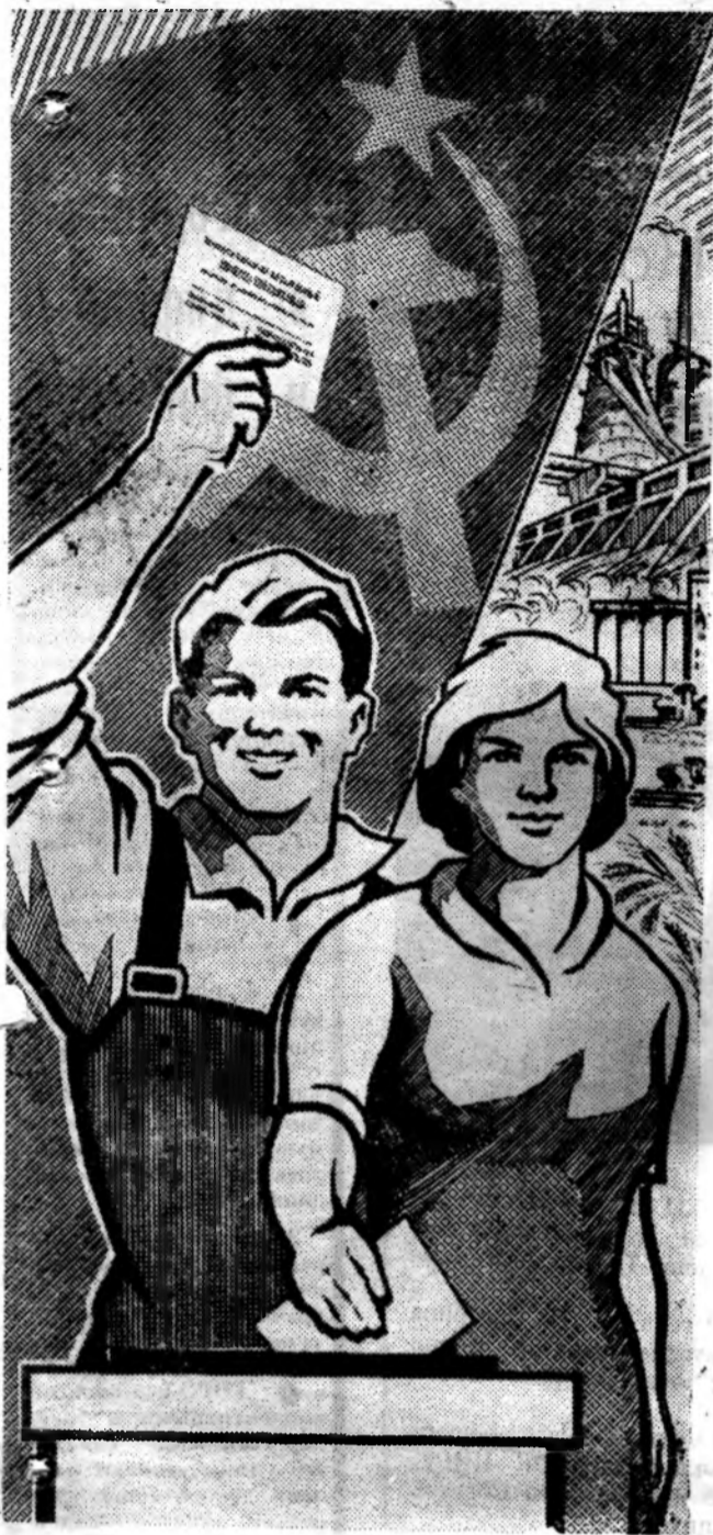
Плакат художника С. Андреева.