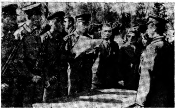
Принятие воинской присяги — большое волнующее событие в жизни новобранцев, дающих родине клятву верности.

НА СНИМКЕ: молодые солдаты Венгерской Народной армии принимают присягу.