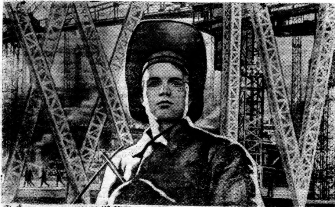
24 СЪЕЗДУ КПСС — НАШИ ТРУДОВЫЕ ПОБЕДЫ!

С 15 января по 10 февраля 1971 года, в каждом хозяйстве района решено провести проверку и взаимопроверку хранения семян.