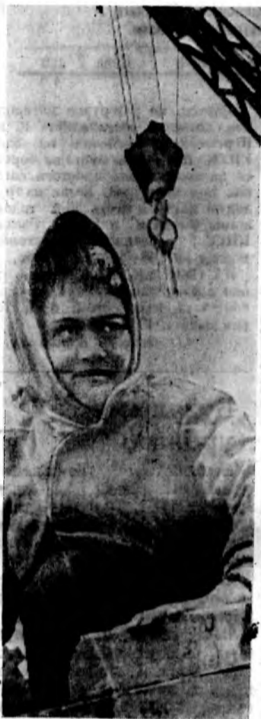
ЗНАКОМЬТЕСЬ: КОМСОМОЛКА ЦЫГАНКОВА

А. ГУРГЕНИДЗЕ, В. МОСЕШВИЛИ. (Корр. ТАСС).