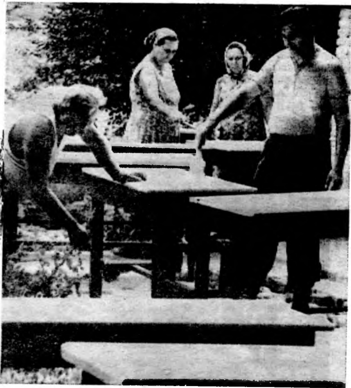
Две недели отделяют нас от того дня, когда учащиеся школ сядут за парты. Все ли сделано для того, чтобы детям было удобно? Этим озабочены сотрудники школ. Они еще и еще раз проверяют не упущена ли какая мелочь.