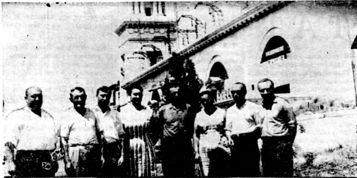
Цимлянской ГЭС — 18-лет

Торжества по случаю завершения строительства проходили в воскресенье. День выдался жаркий. Строительная площадка вблизи здания ГЭС — в праздничном убранстве. Из живых цветов красочно выполнен герб Советского Союза. На митинг собралось более 10 тысяч человек. Приеха-