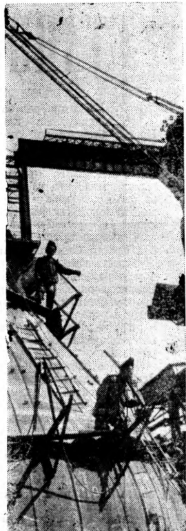
Ударными темпами возводится на Карагандинском металлургическом заводе третья казахстанская дома — пусковой объект 1970 года.

На снимке: на строительстве третьей казахстанской дома.